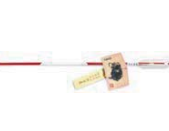
厄除神矢 (朱) 70cm