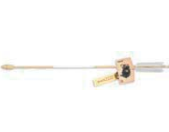
錆矢 (かぶらや) 90cm