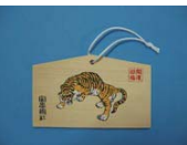
諸願成就祈願十二支絵馬