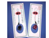
ミニランドセル鈴守