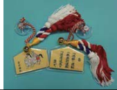
絵馬型交通守・ステッカー付