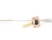
開運神矢 (白) 70cm