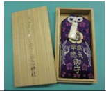
病気平癒守 (桐箱入り)